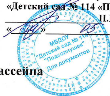
График посещения бассейна