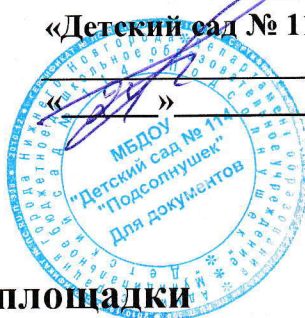
График спортивной площадки