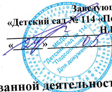
График распределения организованной деятельности